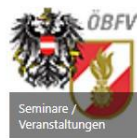
Seminare / Veranstaltungen